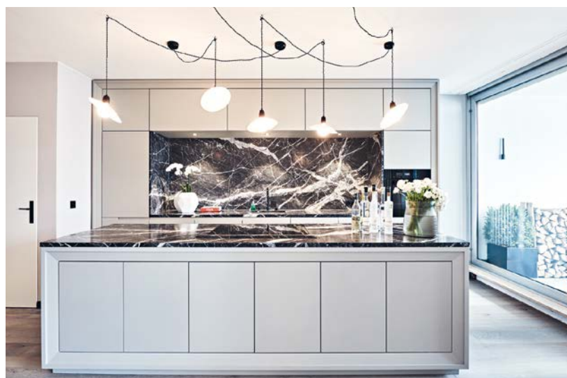
OBEIN: In dieser Privatwohnung setzen breite, natürliche Eichenböden dem modernen Küchenblock Wärme entgegen. UNTEN: Eines der selten gewordenen Exemplare – elegantes Esszimmer in einer Münchner Villa