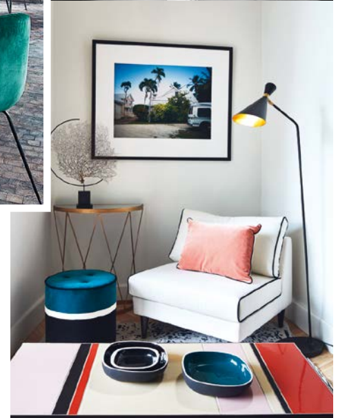
OBEN: Velours in abgetönten Nuancen bestimmt das Restaurant im Pariser Designhotel Le Roch. RECHTS: Schicke Ecke im neuen Concept-Store Place des Victoires